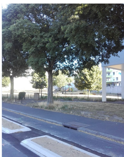
Vue depuis le cœur d'îlot à gauche et vue depuis le boulevard à droite.