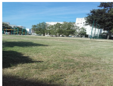
A gauche vue prise depuis le site en direction de l'habitat A droite vue en direction de la rue