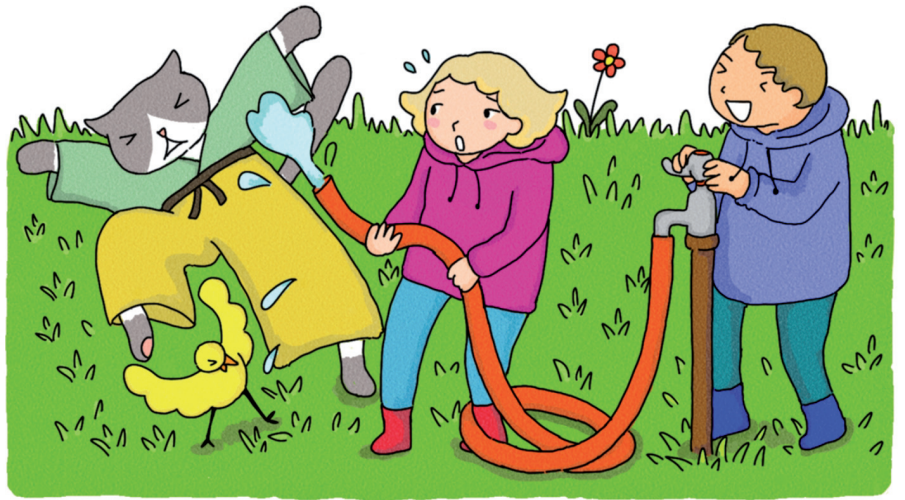
Prévoir un système d'arrosage