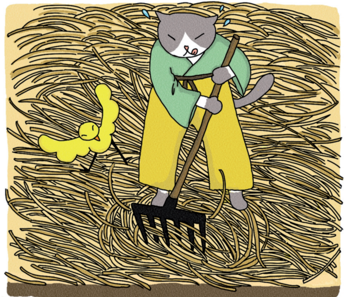
La veille de la plantation : amener et étaler de la paille