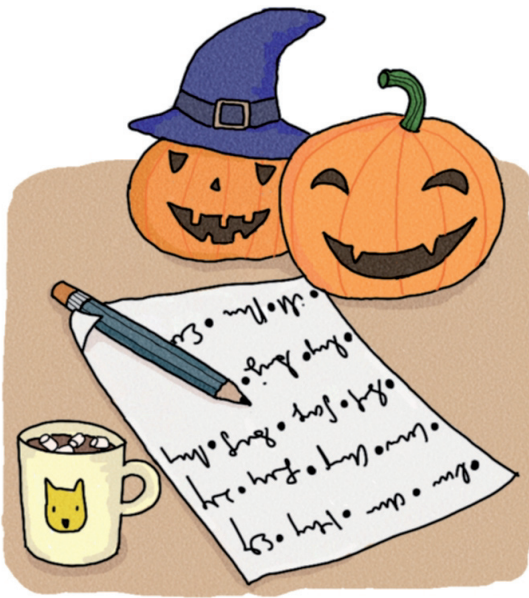
Lister 30 à 50 espèces