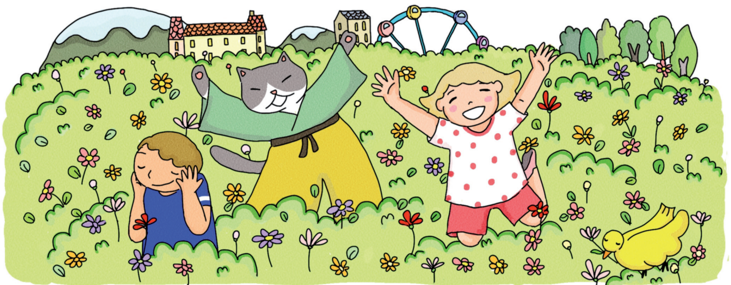
Quelques semaines plus tard...