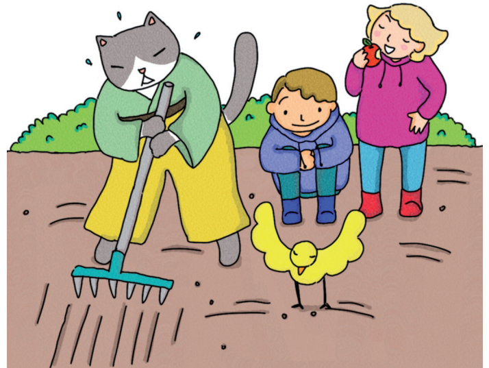
Ratisser pour niveler et enfouir les graines