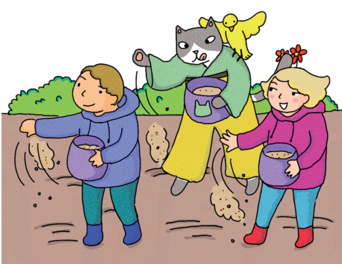
Semer à la volée