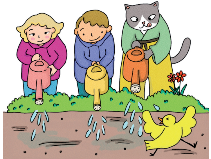
Arroser un peu tous les soirs pendant 15 jours